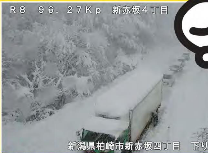
R8 96.27Kp 新赤坂4丁目