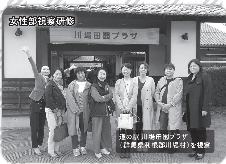
道の駅川場田園プラザ (群馬県利根郡川場村)を視察