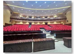
ビンロン省予定会場 (800名収容可)

対象人材： 日本への進路と日本企業でのキャリアはまだ想像できておらず、まだ日本行きの進路を決断するには至っていないが、日本にはとても好意的な印象を持っている、 ビンロン省内や近県(カントー市他)在住の大学生・短大生など(4年生や卒業済学生を中心に参加募集) 。 外国企業から直接キャリアの話を聞いたことはほぼない。県省間で交流協定(MOU)を締結し、省政府が労働人材の新潟への派遣を推進しているため、学生等は安心感を持って参加。