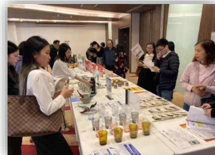
（写真はイメージです）