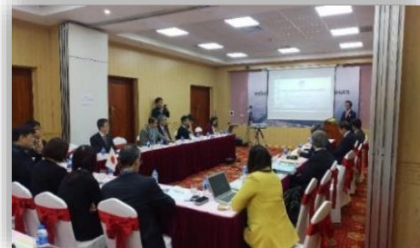
（写真はイメージです）