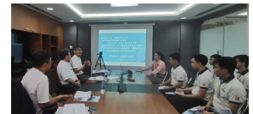
個別面談会の様子

専門分野： 大卒人材は、機械、電気電子、自動化、建築建設、IT、食品、農業、ホテル、介護他。短大・高校卒は全分野。 日本語力： エスハイ社の学校部門KAIZEN吉田スクールに入学後の既習期間により、ビギナー～N3以上レベルまで。