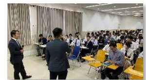
大学内説明会の様子

対象人材： ほとんどはまだ日本行きの進路を決断するには至っていない、ホーチミン市内の大学生。地方から上京して下宿・通学中の学生が多数派、ホーチミン市出身者は一部。 上位校・難関校はホーチミン市など大都市圏に多い。 外国企業から直接キャリアの案内を聞いたことがある学生も比較的多い。 ※一部は既に日本進路を志望。(4年生や卒業済み学生を中心に参加募集)。