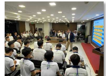
会社説明会の様子

対象人材： 全員が既に日本への進路を希望しており、日本語をはじめとした準備学習中で、日本企業の募集に対して求職中の、大学・短大・高校卒の人材。(=内定すれば最も早期に来日可能。) 南部を中心としたベトナム全土出身。